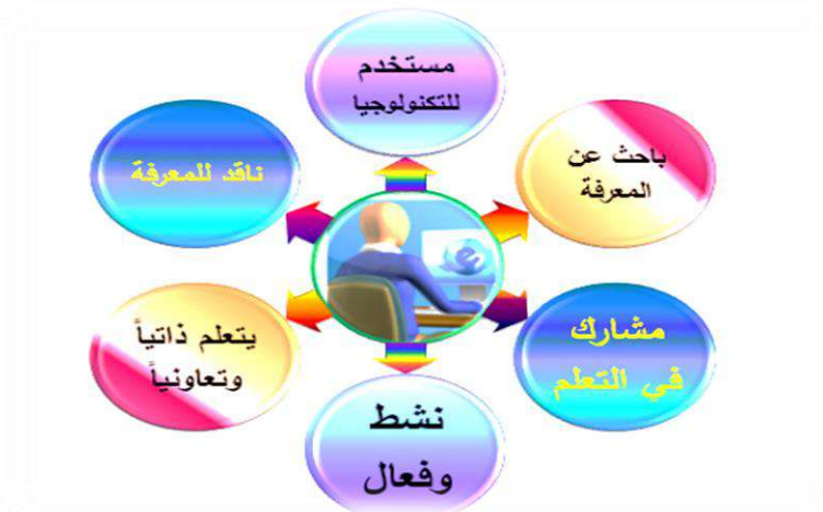
شكل رقم ( 4 ) يوضح المتعلم وفق التعليم الافتراضي

إن دور المتعلم ضمن التعليم الافتراضي يكون من خلال اعتبار المتعلم هو محور العملية التعليمية ويترتب عليه أعمال عدة تتضمن التفاعل ضمن الحصة التعليمية الافتراضية والحوار والنقاش ضمن المجموعات التعليمية الافتراضية من أجل المشاركة الفعالة بين المتعلمين وخلق روح التعاون فيما بينهم ويستطيع المتعلم من خلال التعليم الافتراضي تحقيق التعليم الذاتي بشكل جيد ودون قيود زمنية ومكانية والذي يعطي راحة واستقلال أكثر في عملية تعليم الطلبة. ( الشناق ودومة ، 2009 : 341 )