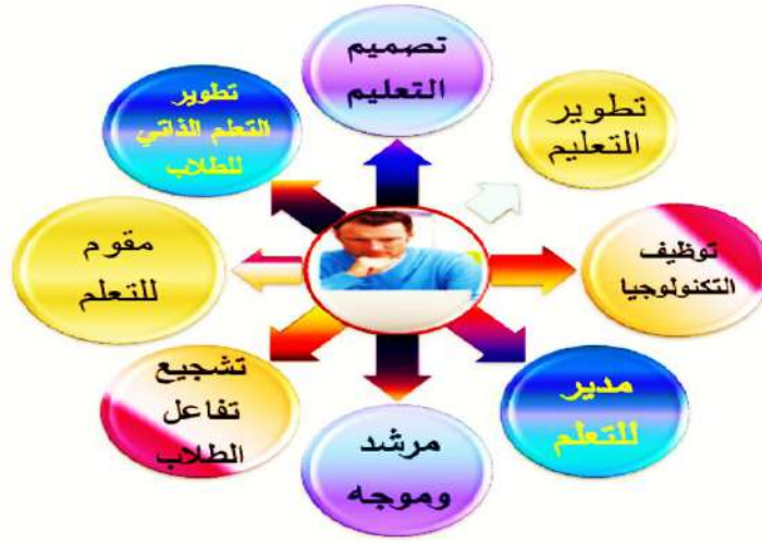
شكل رقم ( 3 ) يوضح المعلم وفق التعليم الافتراضي