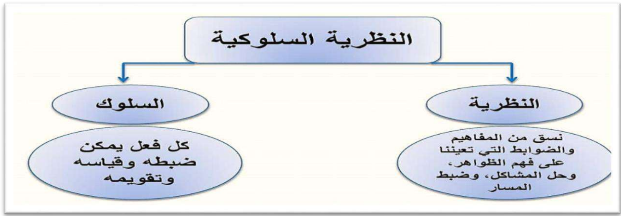
شكل رقم ( 2 ) يوضح لنظرية السلوكية

والتعليم الافتراضي الإلكتروني يرتبط ارتباطا وثيقا باستجابة وسلوك المتعلم لأن الفكرة الأساسية له قائمة على دراسة إمكانات الدماغ المتعلقة بتوقع حدث معين ومراقبته وبناء على ذلك يحدث التغير للبيئة المعرفية الخاصة بالموضوع.